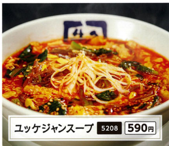
ユッケジャンスープ 5208 590円