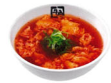
旨辛たまごスープ 10641 390円