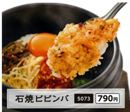
石焼ビビンバ 5073 790円

お肉といっしょに食べるもよし。メに食べるもよし。 定番メニューから牛角オリジナルまで。