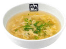
たまごスープ 5206 390円