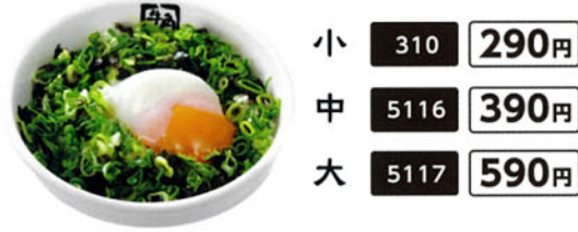
小 310 290円 中 5116 390円 大 5117 590円